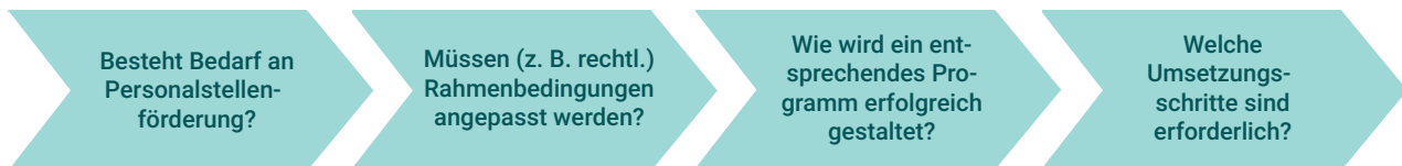
Abbildung 1: Fragen vor der Entscheidung zur Einrichtung einer Personalstellenförderung

Mit folgenden Fragen kann eine erste Einschätzung getroffen werden, ob die Einrichtung eines Programmes mit Personalstellenförderung sinnvoll und auch erfolgreich sein kann.